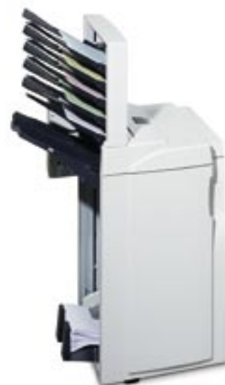
DF-650 og MT-1

Hvor blev hæftemaskinen af? Det gør ikke noget, 3.000 ark efterbehandler med multipositions hæftning (DF650, tilbehør) vil udføre hæftningen. Hvor blev mit job af? Den ekstra multi-bakke (MT-1, tilbehør) ved det muligvis - den kan tage efterbehandlede sæt (hullede, hæftede) fra print eller kopiering, og forhindrer hele afdelingens output i at overlappe. En mailboks foretager sorteringen, der sikrer, at de eneste fingeraftryk på dine præsentationer, vil være dine egne.