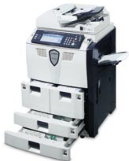
Nydesignede håndtag gør det muligt at åbne papirbakkerne med én finger

Kyoceras modulære design giver fleksible funktioner , der giver mulighed for deling af alt fra enkle rapporter til innovative nye ideer på en kreativ måde. Standardkassetterne består af en 3.000 arks højkapacitetsarkføder, to 500 arks universalarkfødere og en 100 arks multifunktionsbakke. Tilsammen kan de håndtere en lang række papirvægte og formater. Med adgang til flere arkfødere kan du vælge mellem forskellige papirtyper: f.eks. almindeligt 80g kopipapir til internt brug og kraftigere papir til kunder. Uanset arbejdsbyrdens størrelse, er du forberedt.